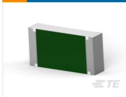
TE 产品编号 1-2176398-4 3502 47K 1%