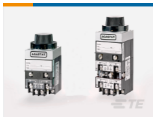
TE 产品编号 1755170-1 7022OCIM=RLY,STD,OFF,2P,24V,15S,I, M