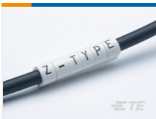
TE 产品编号 EC0437-000 06153411