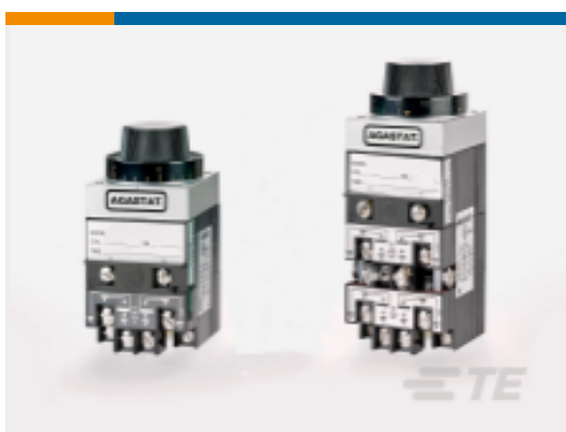
TE 产品编号 1-1423159-9 7012PB=RLY,STD,ON,2P,125VDC, 5