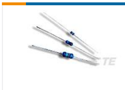
TE 产品编号1622509-1 LR1 1% 511R