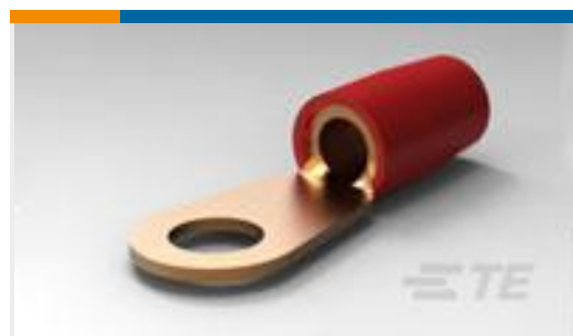
TE 产品编号324082 TERMINAL,T-N R 8 1/4