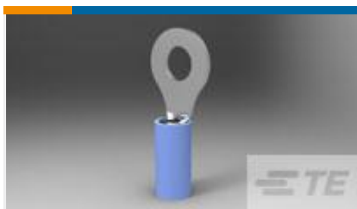
TE 产品编号321045 TERMINAL,PIDG R 16-14 1/4