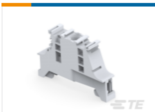
TE 产品编号1SNK900001R0000 BAM4