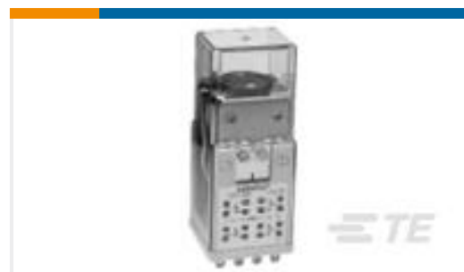
TE 产品编号1423155-6 GPDN=RLY,GEN,PURP,125VDC