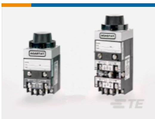
TE 产品编号 1-1423159-9 7012PB=RLY,STD,ON,2P,125VDC, 5