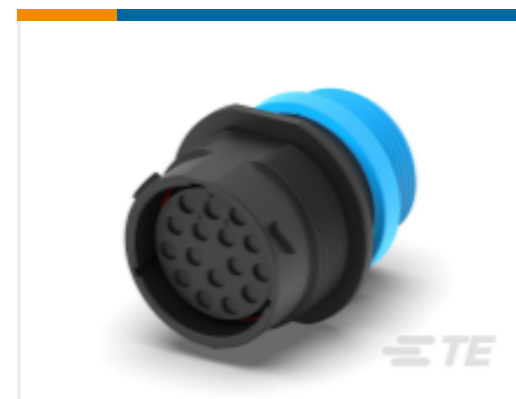
TE 产品编号HDP24-24-16SE-L015 REC, 16P, BLK, E, THD, 12, S