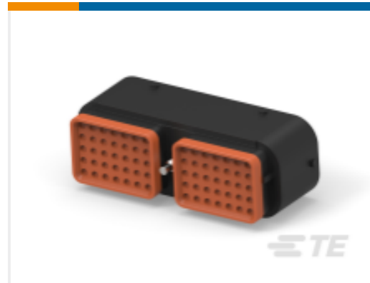
TE 产品编号DRC16-70SBE-P013UK PLG, 70P, BLK, E, SEAL BOND, B