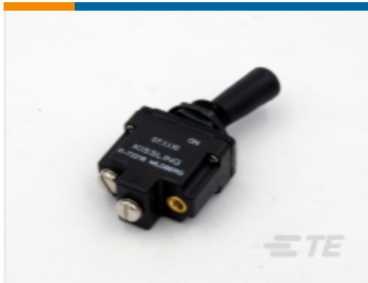
TE 产品编号K1007153 Toggle Switch 08-1-1-13