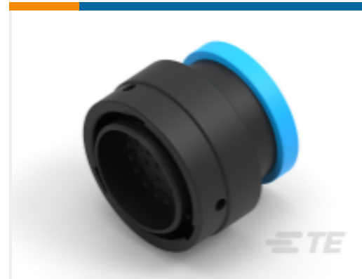
TE 产品编号YHDP26-24-35PEL017 PLG, 35P, BLK, E, RNG, 16/20, P