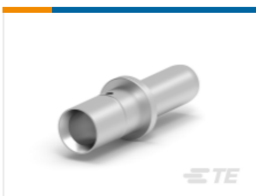
TE 产品编号SRK-PC-080-25-601 PIN, SOLID, SIZE M8, 25mm2, AG