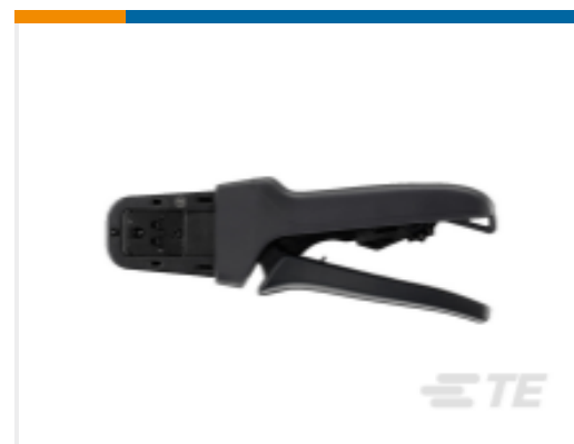
TE 产品编号DTT-20-03 CRIMP TOOL