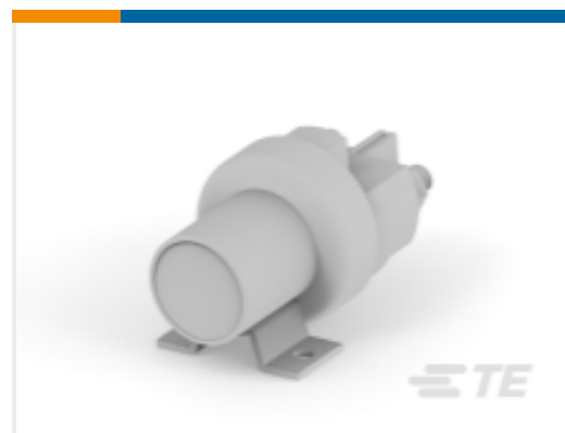
TE 产品编号K1008699 Relay 26-60-05