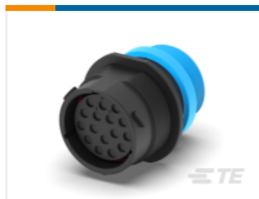
TE 产品编号HDP24-24-16SE-L015 REC, 16P, BLK, E, THD, 12, S