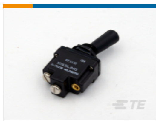
TE 产品编号K1007153 Toggle Switch 08-1-1-13