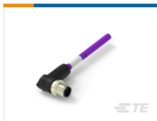
TE 产品编号TAB62246501-040 M12B2-MR-PUR TORSION-4.0M