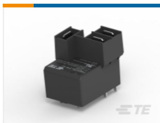
TE 产品编号1558676-6 T9GS1L24-22