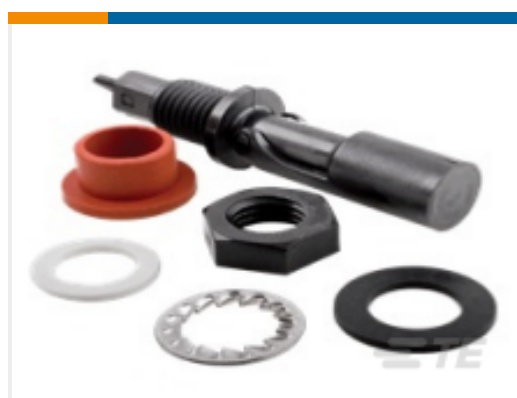
TE 产品编号80645-000 LS809-51 Liquid Level Sensor