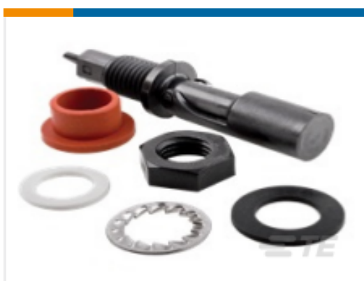
TE 产品编号80645-000 LS809-51 Liquid Level Sensor