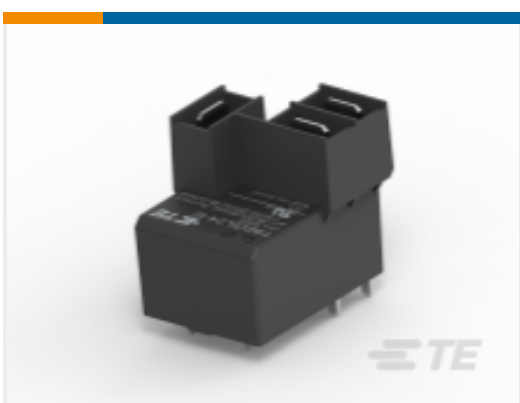
TE 产品编号1558676-6 T9GS1L24-22