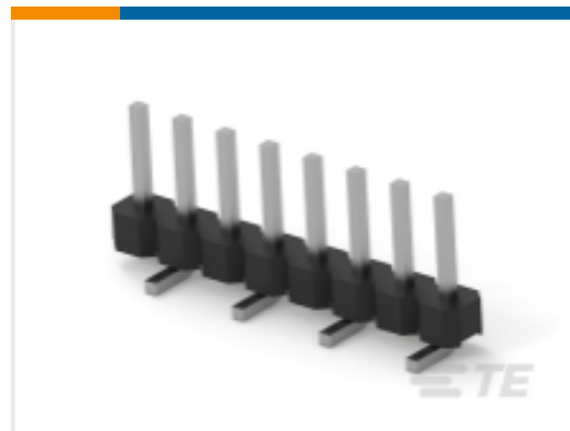
TE 产品编号 2842104-8 8P,2MM,BRK HDR,SRVT,SMD,0.76AU, TR W/CAP