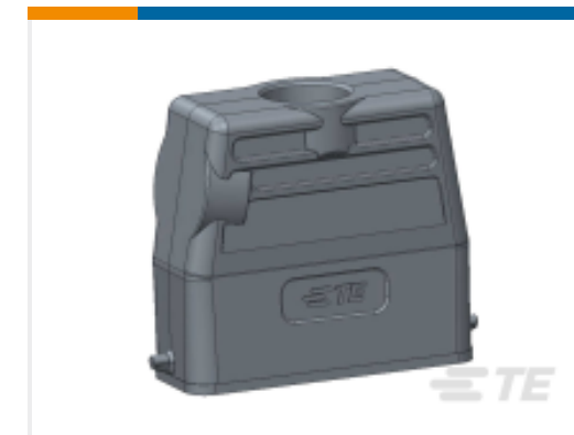
TE 产品编号 T1349160120-000 H16A-TGH-M20