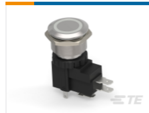
TE 产品编号 1-2364686-5 AVH22 FLT SS MT RNG GRN 24V16A