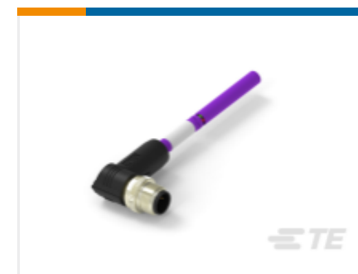
TE 产品编号 TAB62246501-040 M12B2-MR-PUR TORSION-4.0M