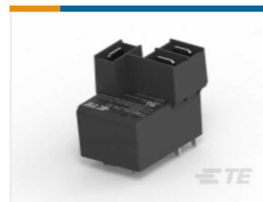
TE 产品编号 1558676-6 T9GS1L24-22