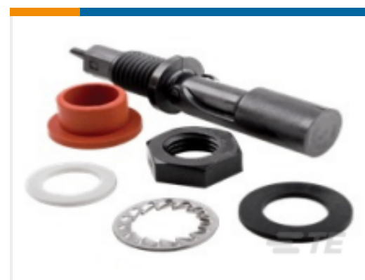
TE 产品编号 80645-000 LS809-51 Liquid Level Sensor