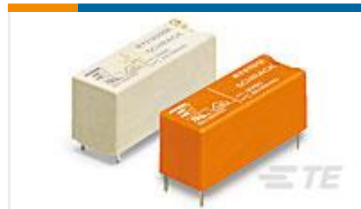
TE 产品编号8-1393224-8 RY533012