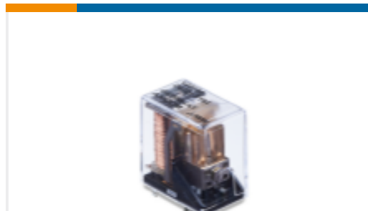
TE 产品编号2-1393809-2 Signal Relays: 5 Amp, Monostable DC