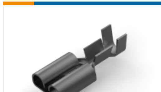
TE 产品编号925603-2 FF 250 REC 0.5-1.5MM2 TPPB LP