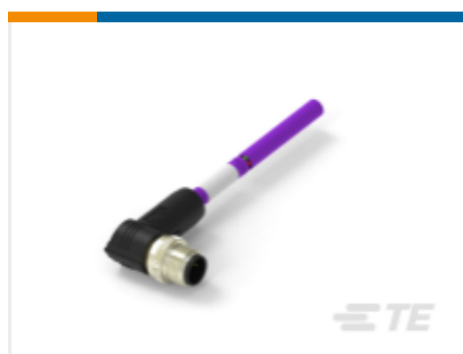
TE 产品编号TAB62246501-040 M12B2-MR-PUR TORSION-4.0M