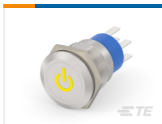
TE 产品编号6-2213766-9 AV19 DPL 5A POWER LED YELLOW 12V