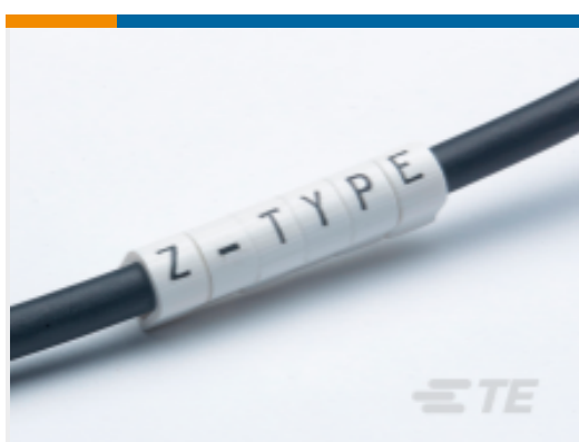
TE 产品编号EC0372-000 Z-Type Push-On Markers