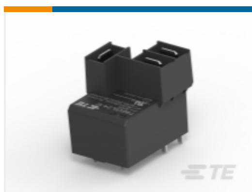
TE 产品编号1558676-6 T9GS1L24-22