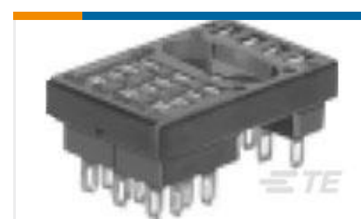
TE 产品编号 4-1393143-1 27E446=SOCKET,R10,2POLE,FLG-MNT,SOLDER