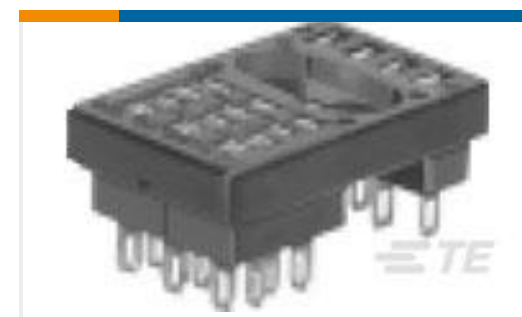
TE 产品编号 2-1393143-4 27E212=SOCKET,R10,10,PC,PHEN