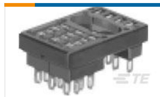
TE 产品编号 1-1393143-1 27E128=SOCKET,R10,10,PC,PHEN