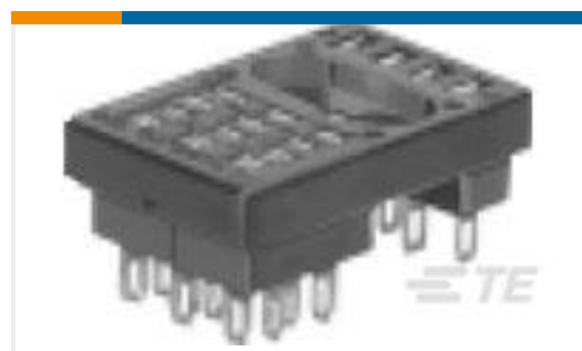
TE 产品编号 1393143-8 27E125=SOCKET,R10,10,SLG,PHE