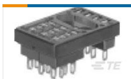
TE 产品编号 2-1393143-1 27E193=SOCKET,R10,11,PC,PHEN