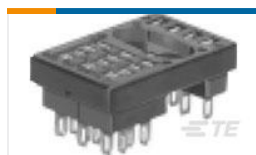
TE 产品编号 3-1393143-4 27E317=SOCKET,R10,2POLE,W/BRACKET