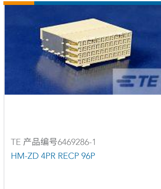
TE 产品编号6469286-1 HM-ZD 4PR RECP 96P