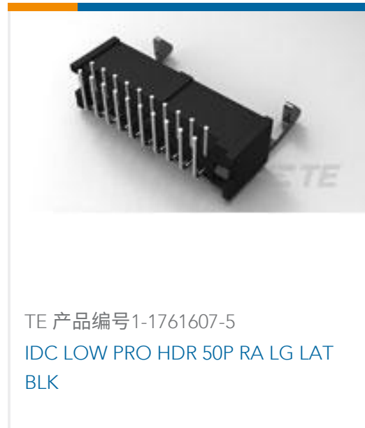
TE 产品编号1-1761607-5 IDC LOW PRO HDR 50P RA LG LAT BLK