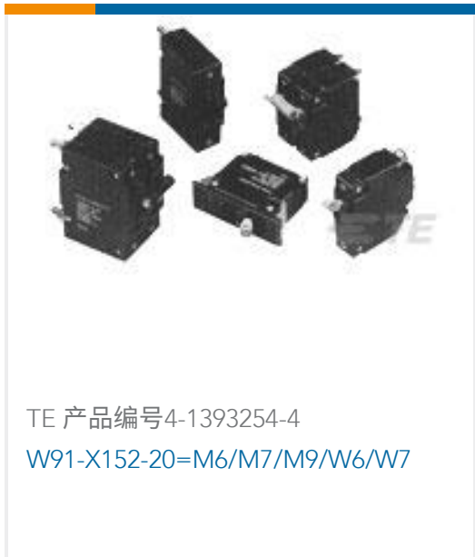
TE 产品编号4-1393254-4 W91-X152-20=M6/M7/M9/W6/W7