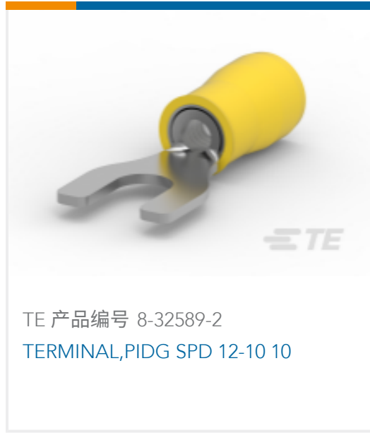
TE 产品编号 8-32589-2 TERMINAL,PIDG SPD 12-10 10