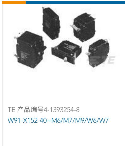
TE 产品编号4-1393254-8 W91-X152-40=M6/M7/M9/W6/W7