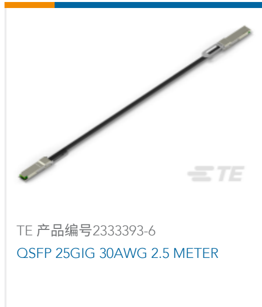
TE 产品编号2333393-6 QSFP 25GIG 30AWG 2.5 METER