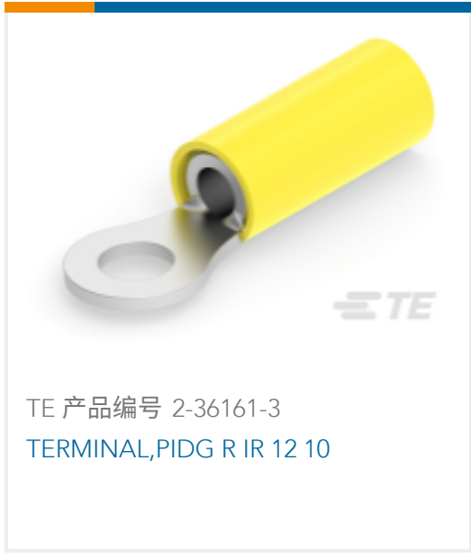
TE 产品编号 2-36161-3 TERMINAL,PIDG R IR 12 10