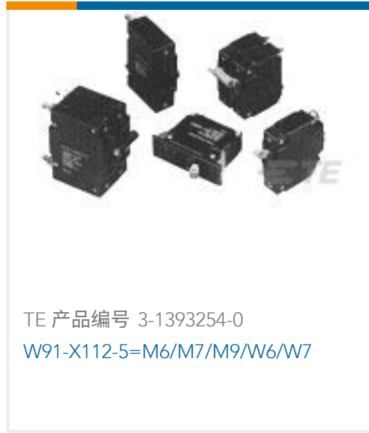
TE 产品编号 3-1393254-0 W91-X112-5=M6/M7/M9/W6/W7