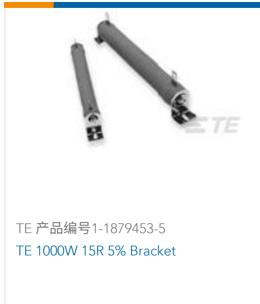
TE 产品编号1-1879453-5 TE 1000W 15R 5% Bracket