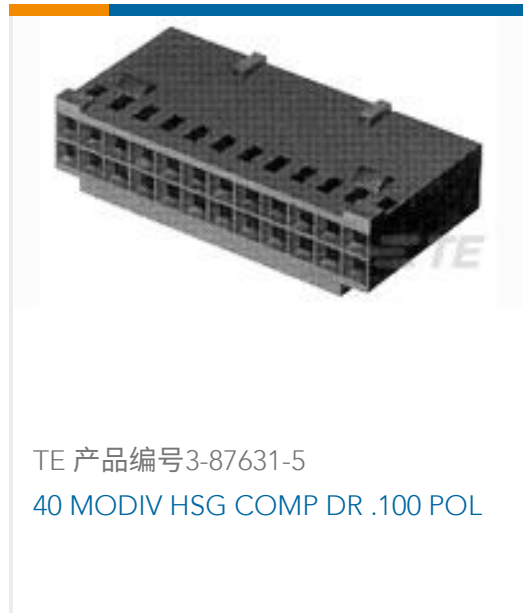
TE 产品编号3-87631-5 40 MODIV HSG COMP DR .100 POL