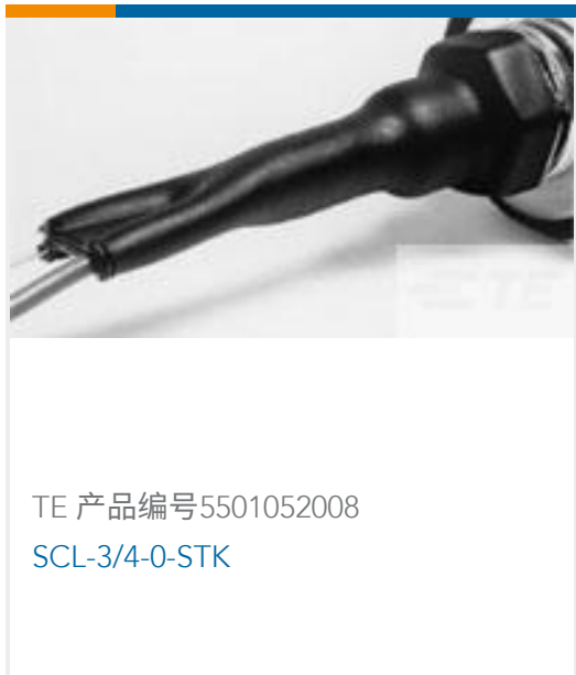
TE 产品编号5501052008 SCL-3/4-0-STK