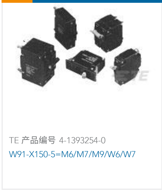
TE 产品编号 4-1393254-0 W91-X150-5=M6/M7/M9/W6/W7