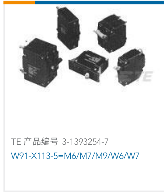
TE 产品编号 3-1393254-7 W91-X113-5=M6/M7/M9/W6/W7