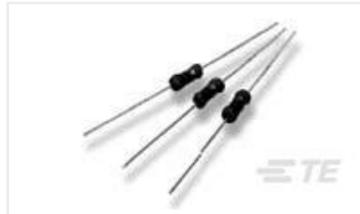
TE 产品编号1879354-6 RR03 5% R51 AMMO