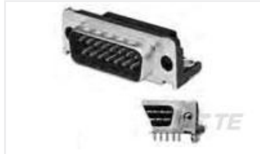
TE 产品编号5747842-3 25 MSFL PLUG RA 318 (IN,FM,BL)