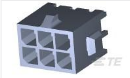
TE 产品编号3-794630-6 06P MICRO MNL ASSY VRT HDR LF