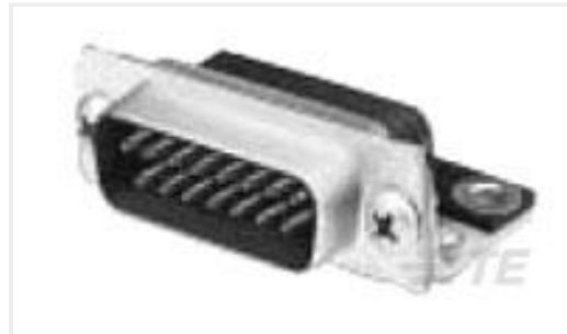
TE 产品编号5745434-8 09 PLUG RA/MS 454