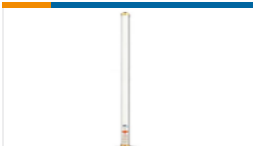
TE 产品编号FG4303 OMNI,FG,430-440MHZ,100W 435MHz, 5dBi