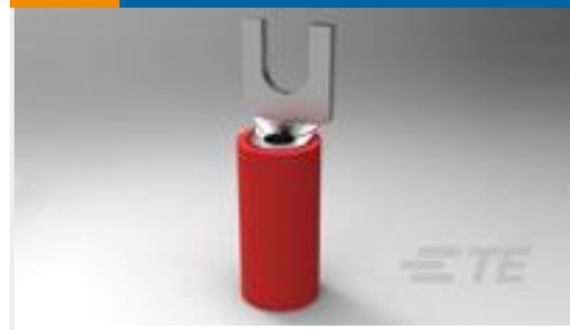
TE 产品编号1-327717-2 PIDG SPD 22-16 COMM 22-18MIL 4