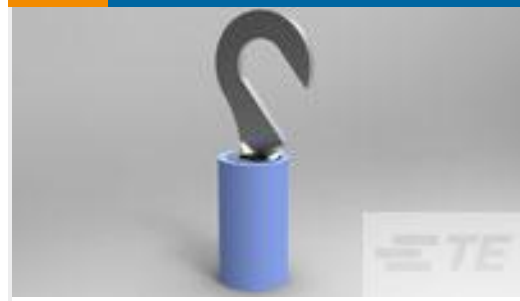
TE 产品编号2-320306-1 TERMINAL,PIDG HK 16-14 8