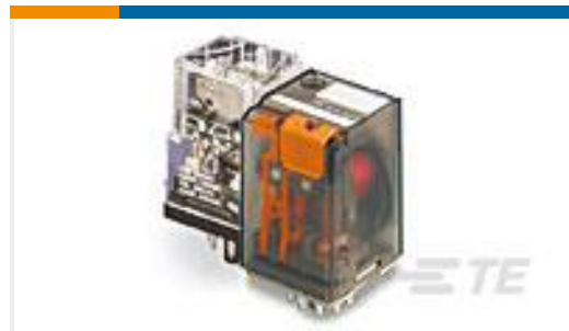
TE 产品编号4-1393104-9 KRPA-11DN-110=KRPA