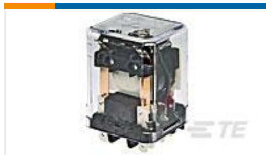
TE 产品编号8-1393113-3 KUEP-11A15-120=RELAY,GENPUR,QC