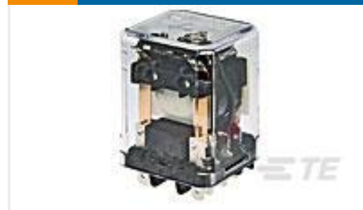
TE 产品编号1-1393114-1 KUEP-7D15-24=KU