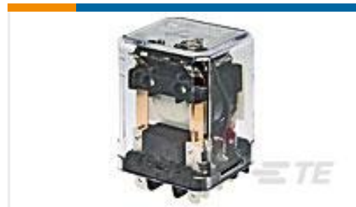
TE 产品编号4-2027183-3 KUEP-11D15-125=RELAY,3A,2C, AGCDO,QC.187,