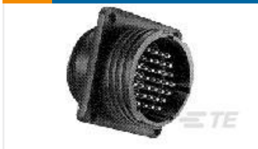
TE 产品编号206036-8 RECEPT,SZ 17-16 CPC,W/INSERTS