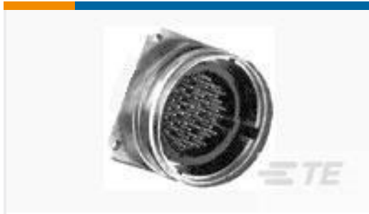
TE 产品编号208491-1 CMC RECEPTACLE ASSY,SIZE 22