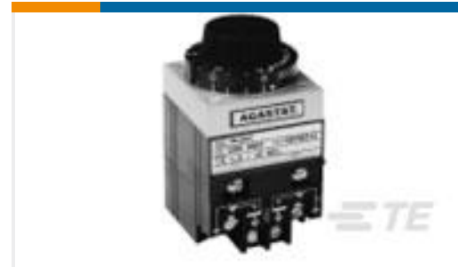
TE 产品编号3-1423164-3 7022PK=RLY,STD,OFF,2P,125VDC,