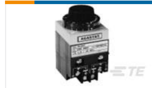
TE 产品编号1423157-7 7012ACLL=RLY,STD,ON,2P,120VAC