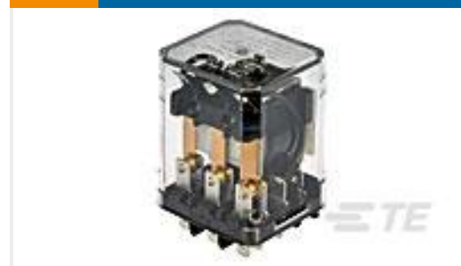
TE 产品编号6-1393118-0 KUP-5A15-24=KU