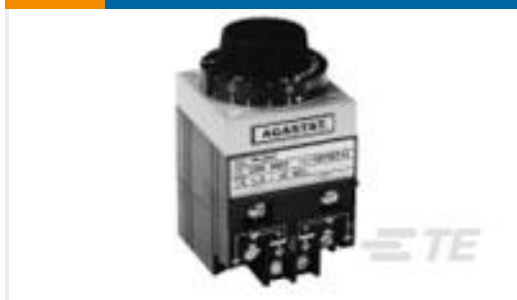
TE 产品编号3-1423159-1 7012PH=RLY,STD,ON,2P,125VDC,30