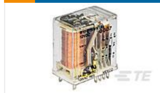
TE 产品编号3-1393767-6 R10-E2Y4-V700=R10