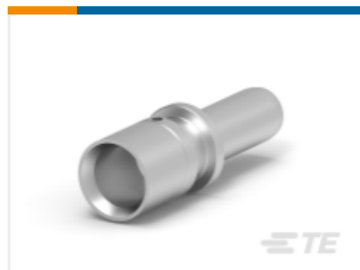
TE 产品编号SRK-PC-080-35-601 PIN, SOLID, SIZE M8, 35mm2, AG