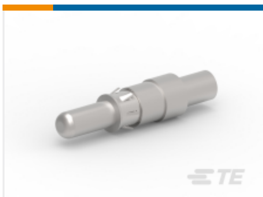
TE 产品编号DARS24296-000A3 CAR PIN STANDARD CONT. #5, silver plated