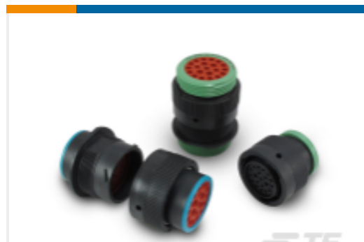
TE 产品编号HDP24-24-35SE DEUTSCH HDP20 Housings