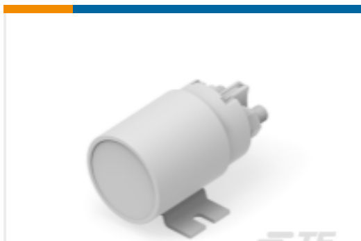
TE 产品编号K1127684 Relay 29-112-12