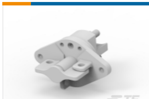
TE 产品编号K1128688 Battery Disconnect 35-411-130-R-900