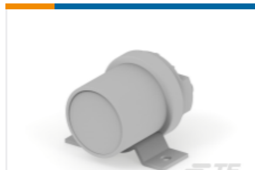
TE 产品编号K1012918 Relay 26-70-04