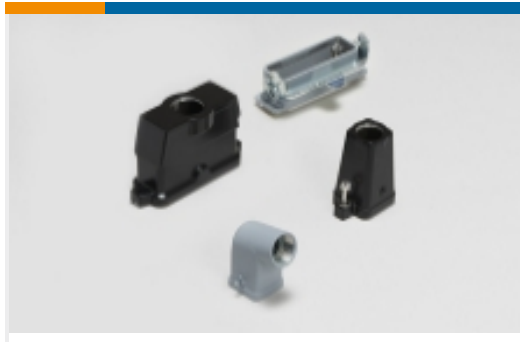
矩形连接器护罩和底座(445)