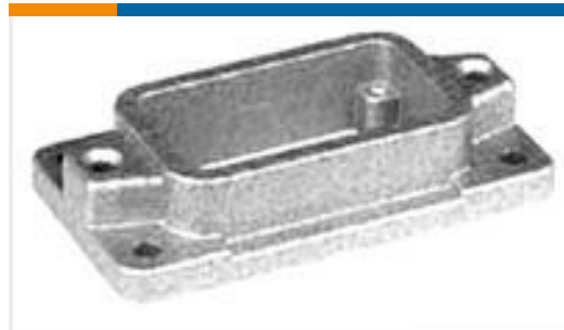
TE 产品编号2-1102618-5 HIP-K.16/40.AG.M6