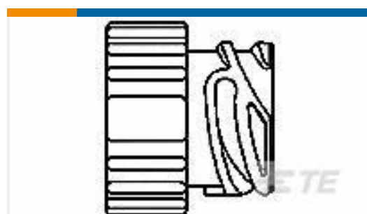
TE 产品编号185636-1 PROTECT CAP 2.5MM PLUG