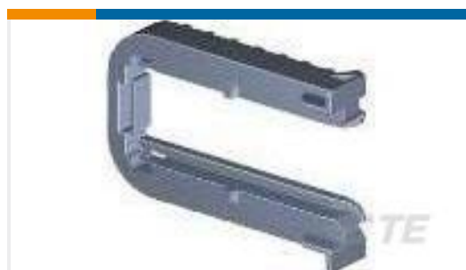
TE 产品编号 1564411-1 SLIDE,TAB HSG GROUP E