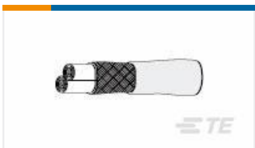
TE 产品编号3828253004 44A1121-16-2/6-9