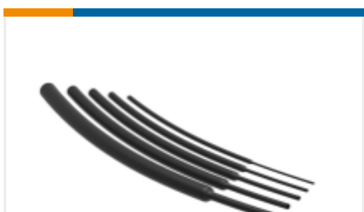
TE 产品编号NB16934001 VERSAFIT-3/64-0-SP