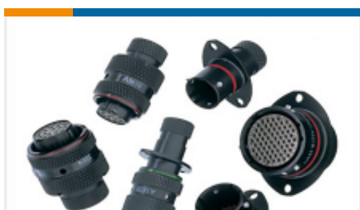
TE 产品编号AS612-35PN-993V PLUG BOOT TERMIN TYPE 6.NO COUPLING R NO