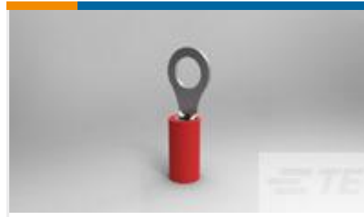
TE 产品编号171508-2 PIDG WIRE TERM, #8, 22-16 AWG