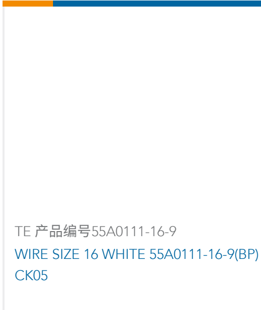
TE 产品编号55A0111-16-9 WIRE SIZE 16 WHITE 55A0111-16-9(BP) CK05