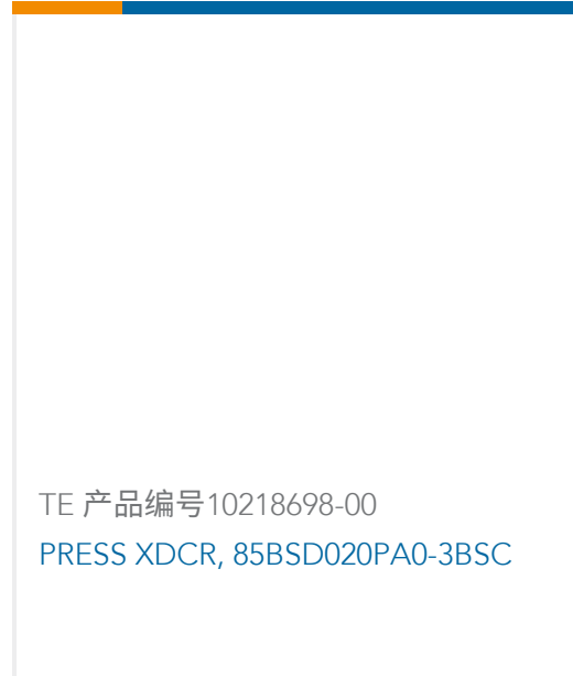
TE 产品编号10218698-00 PRESS XDCR, 85BSD020PA0-3BSC