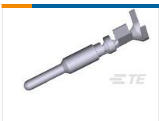
TE 产品编号1-770194-0 UMNLI GRND PIN DUPL AUBR LF