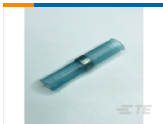
TE 产品编号625371N001 D-110-0083CS954