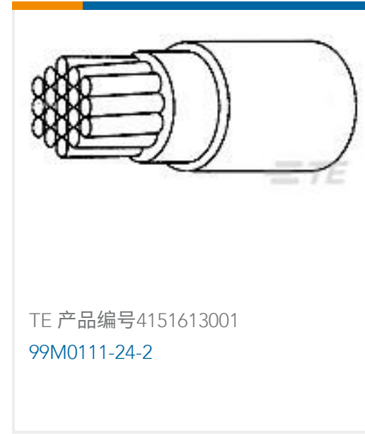
TE 产品编号4151613001 99M0111-24-2