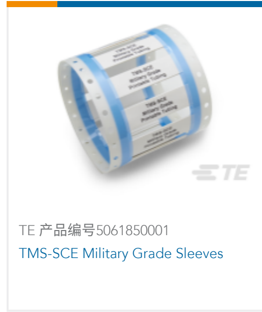
TE 产品编号5061850001 TMS-SCE Military Grade Sleeves