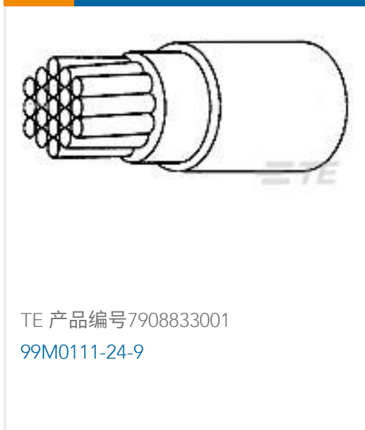
TE 产品编号7908833001 99M0111-24-9