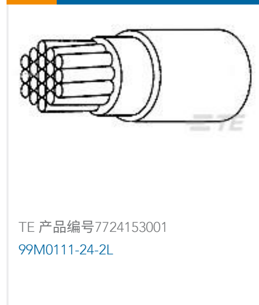
TE 产品编号7724153001 99M0111-24-2L