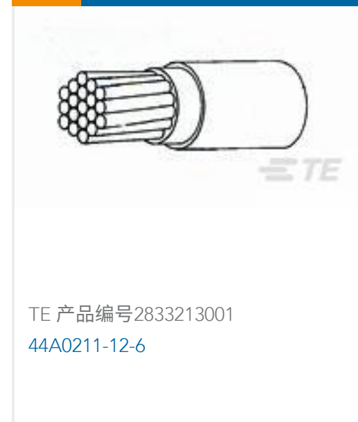
TE 产品编号2833213001 44A0211-12-6