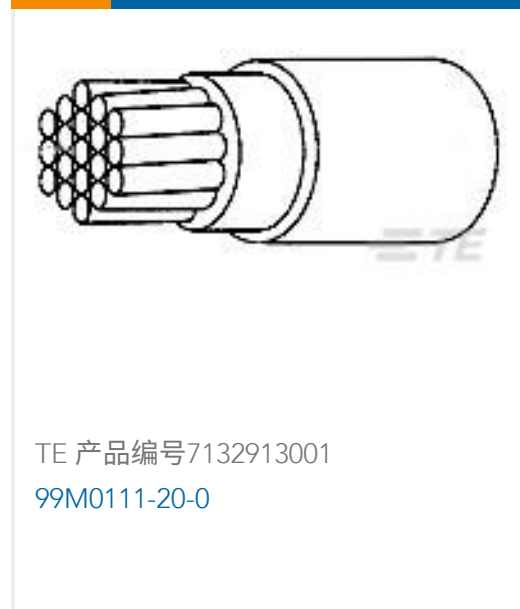
TE 产品编号7132913001 99M0111-20-0