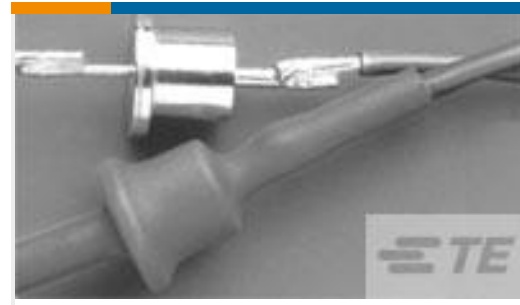
TE 产品编号5677912004 RNF-3000-3/1-X-STK