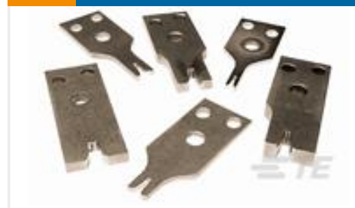
TE 产品编号1-1673600-0 CRIMPER, WIRE (.050" 'F')