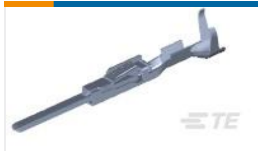
TE 产品编号1718758-3 MCON 1.2 LL TAB SWS AG