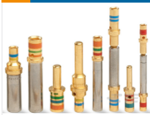
TE 产品编号ZPF000000000000173 006-0044-20 A