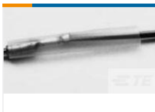
TE 产品编号CV21064001 RW-175-E-3/16-X-SP