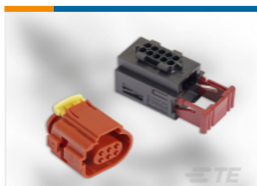
TE 产品编号1-967626-4 Timer Connector Housing