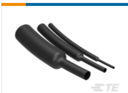
TE 产品编号5069814012 CGPT 2:1 热缩管