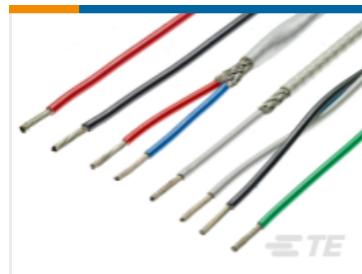
TE 产品编号2611473001 44A0111-12-54