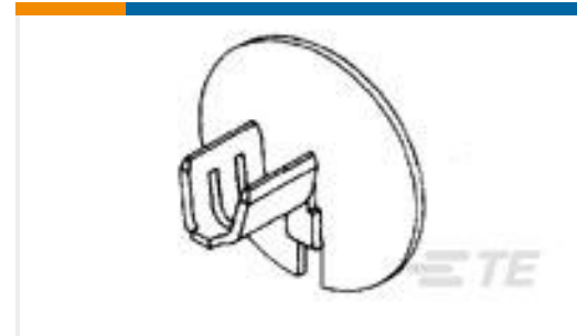
TE 产品编号63020-1 BRUSH TERMINAL 24-20 AWG BR