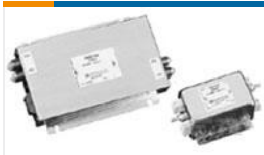
TE 产品编号5-6609074-1 60DCB10B J0=F7955