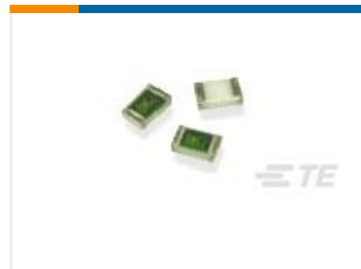
TE 产品编号6-1879127-7 RN 0402 422R 0.1% 10PPM CUT LENGTH