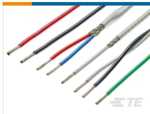
TE 产品编号2611473001 44A0111-12-54