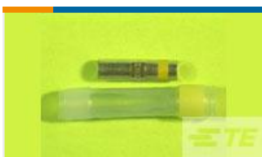
TE 产品编号 650076-000 D-436-38