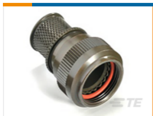
TE 产品编号BTD1-14-08-1-B-SB BTD1-14-08-1-B-SB