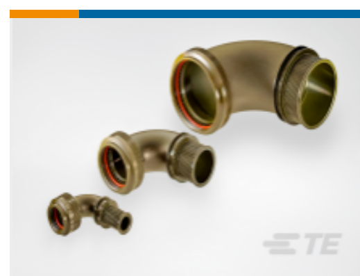
TE 产品编号BTH3-11-05-1-B BTH3-11-05-1-B