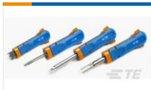
TE 产品编号3-1579007-7 EXTRACTION TOOL