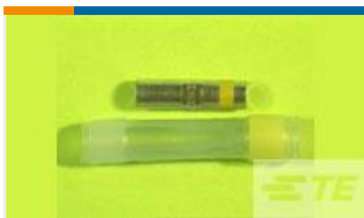
TE 产品编号 650075-000 D-436-37