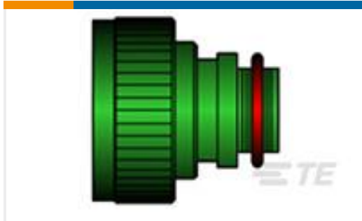
TE 产品编号837783-000 TXR18AB00-1606AI