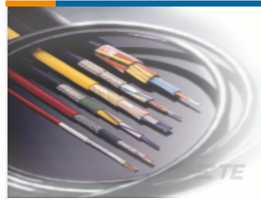
TE 产品编号CQ27763001 100G0111-1.20-0CK0226/6