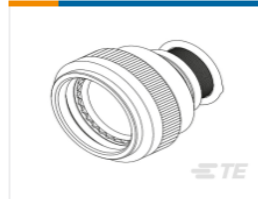
TE 产品编号A57830-000 TXR40AU00-1406AI