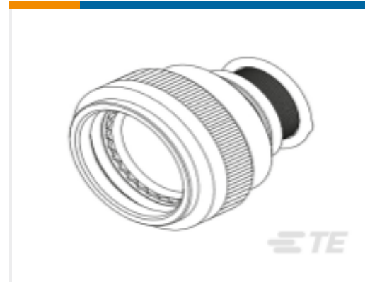
TE 产品编号CZ4501-000 TX40AZ00-0804