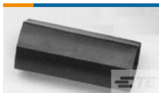
TE 产品编号CU3844-000 HRSR-300FR-8/NM