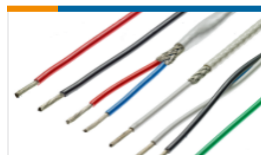
TE 产品编号EG7200-000 44A0121-22-9/927