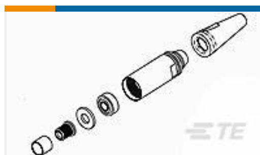
TE 产品编号1828700-1 CBL ADPT,PRO BEAM MINI PLUG 5.0 AL EPDM