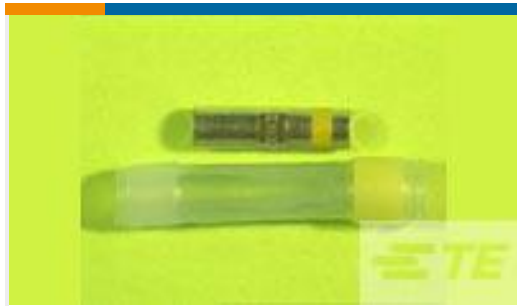
TE 产品编号 650075-000 D-436-37