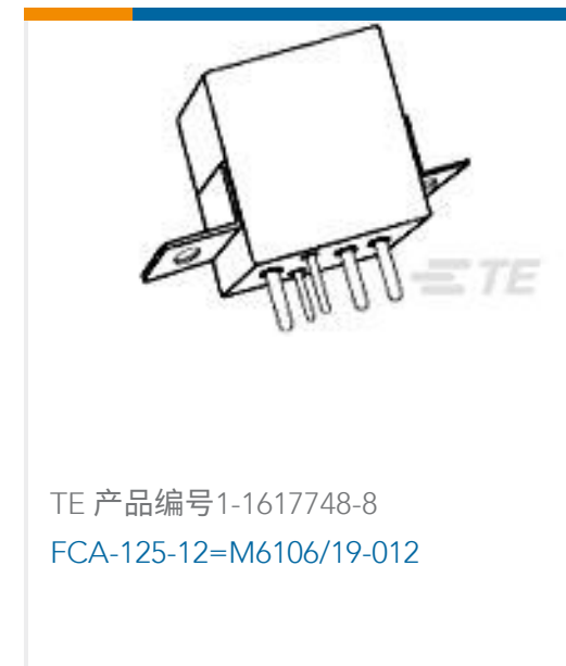
TE 产品编号1-1617748-8 FCA-125-12=M6106/19-012