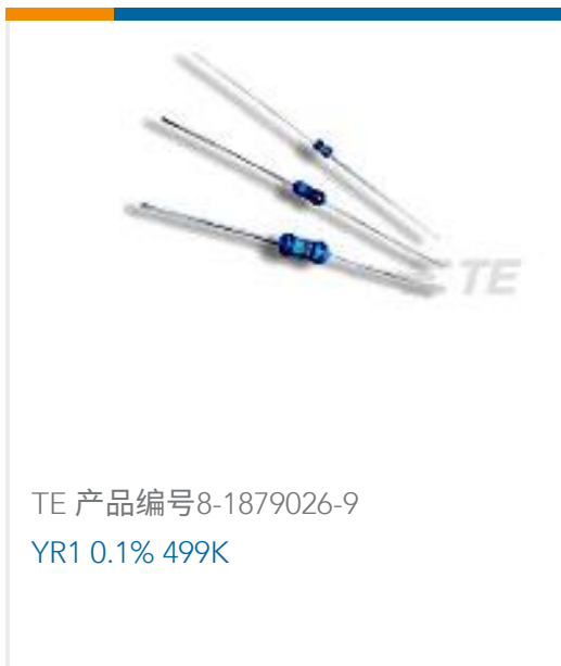
TE 产品编号8-1879026-9 YR1 0.1% 499K