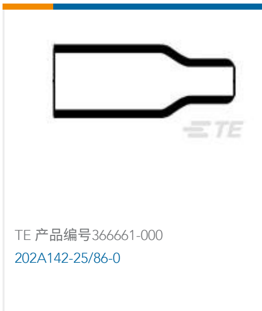
TE 产品编号366661-000 202A142-25/86-0