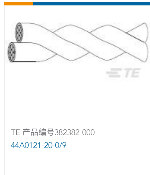
TE 产品编号382382-000 44A0121-20-0/9