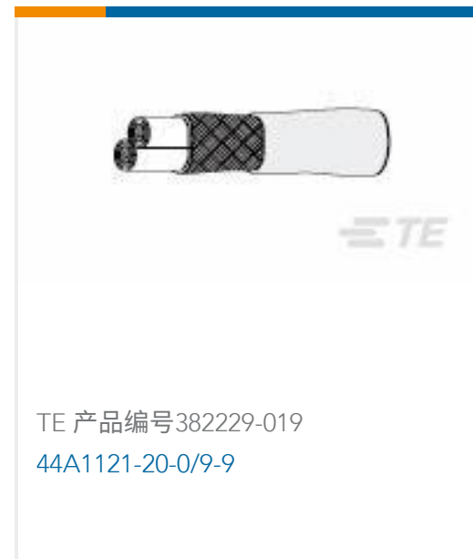
TE 产品编号382229-019 44A1121-20-0/9-9