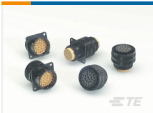
TE 产品编号ZPF00000000018968 FDBA 54-18-11 SW-K-A1198