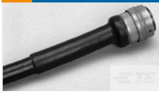
TE 产品编号0682984003 ATUM-12/3-2-SP