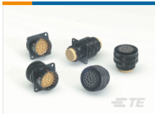
TE 产品编号ZPF00000000018992 FDBA 54-20-16 PN-K-A1198