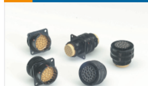
TE 产品编号ZPF00000000018965 FDBA 54-18-11 SN-K-A1198