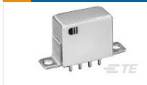
TE 产品编号4-1617001-1 A07B332AC1 = A07 10AMP FULL SI