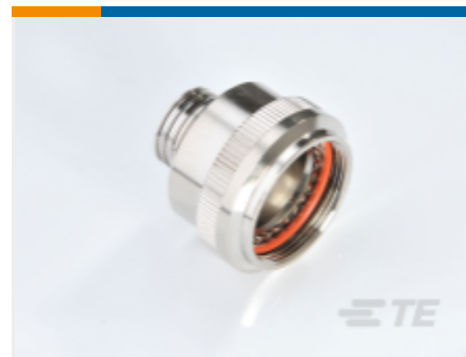
TE 产品编号70H1-19-16-1-B 70H1-19-16-1-B