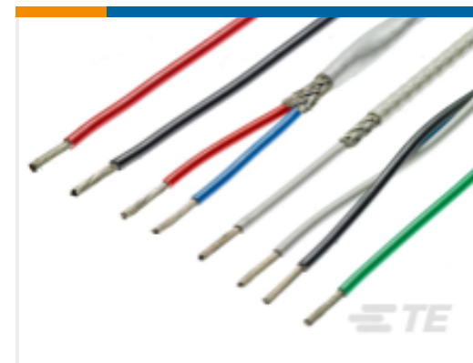
TE 产品编号109761-000 44A0141-20-9/90/92/96