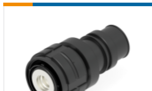
TE 产品编号EK7034-000 PC426HP-BT1-19-70FS-SN-1-ZN