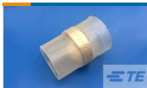
TE 产品编号696684-000 B-051-01-01