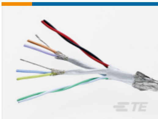
TE 产品编号EP5675-000 U31-26C493C124-0