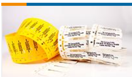
TE 产品编号E17344-000 CM-SCE-TP-1/2-4H-9