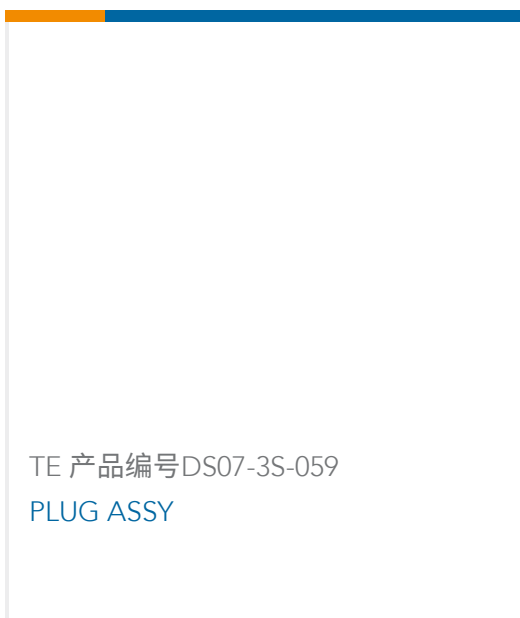
TE 产品编号DS07-3S-059 PLUG ASSY