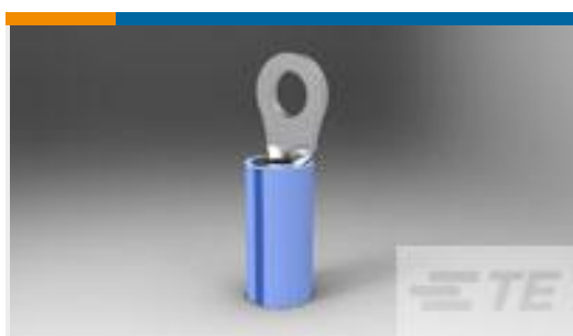
TE 产品编号51864-7 TERMINAL,PIDG R IR 16 10