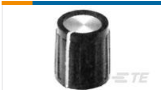
TE 产品编号6-1437624-0 PKG50B1/4=KNOB PLASTIC 1/4 LEX