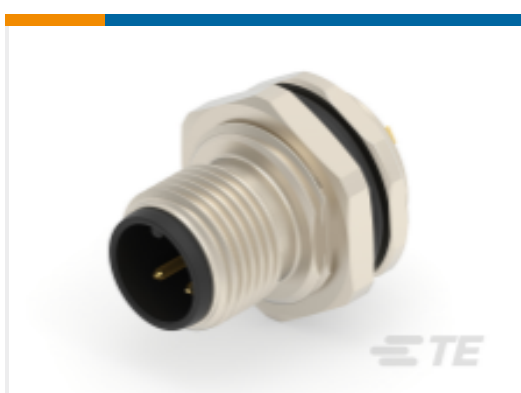
TE 产品编号T4130012031-000 M12,REAR MOUNT,MALE,A,3P, SOLDER WIRE