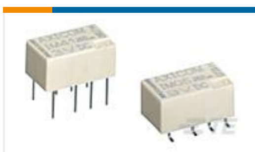
TE 产品编号3-1462039-8 IM06DTS=IM RELAY 140mW 12V