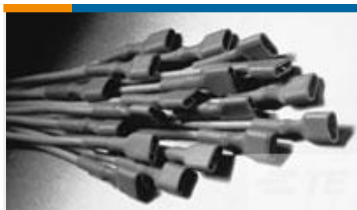
TE 产品编号5913834003 LSTT-6.4-0-SP