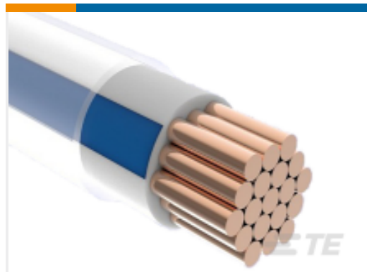
TE 产品编号4956943001 ACW0219-1.00-59(NS)