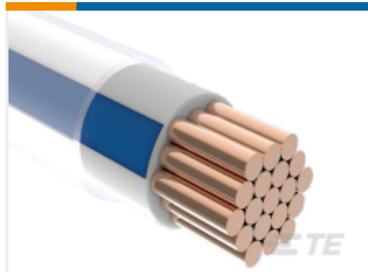
TE 产品编号9850703001 ACW0219-0.50-04(NS)