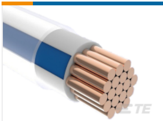
TE 产品编号CD55453001 ACW0219-1.00-51(NS)