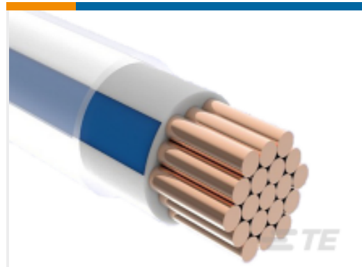
TE 产品编号CD34813001 ACW0219-0.50-43(NS)