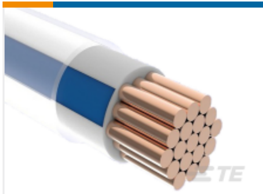
TE 产品编号CQ55273001 ACW0219-10.00-7(S155)