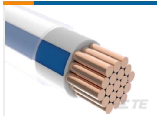
TE 产品编号D812093001 ACW0219-0.50-61(NS)