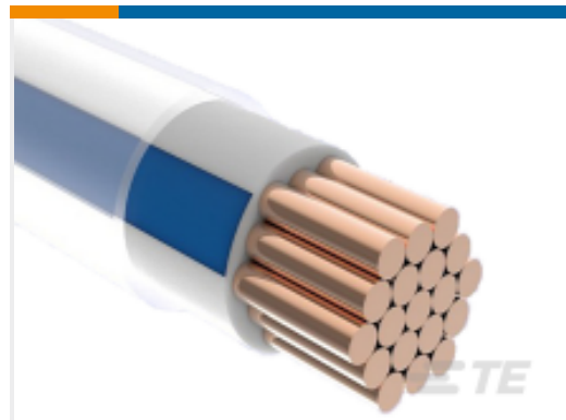
TE 产品编号CT51733001 ACW0219-2.50-42(NS)