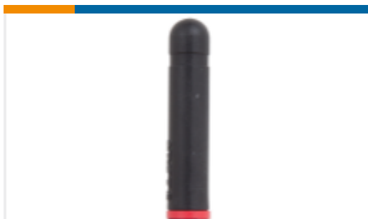
TE 产品编号ANT-433-CW-RH Antenna 1/4 Wave Short 433MHz RPS