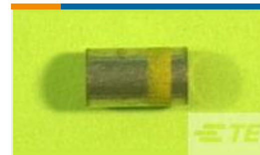
TE 产品编号680105-000 D-609-04