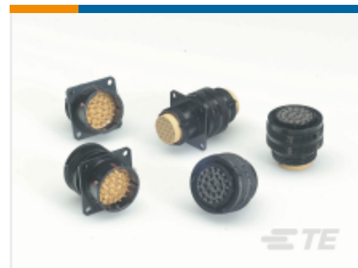
TE 产品编号ZPF000000000020074 FDBA 57-8-33 SN-K 090 A838