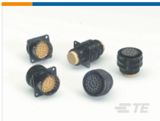
TE 产品编号ZPF000000000019928 FDBA 57-14-19 SN-K 090 A838