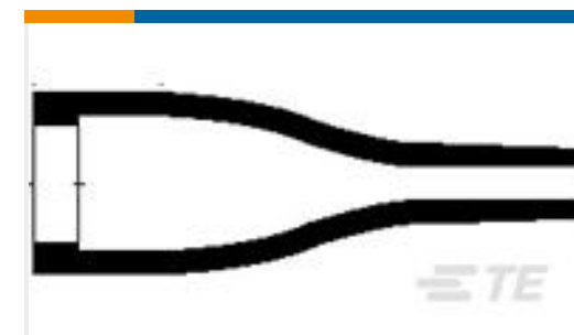
TE 产品编号CP9851-000 204W201-25/225-0