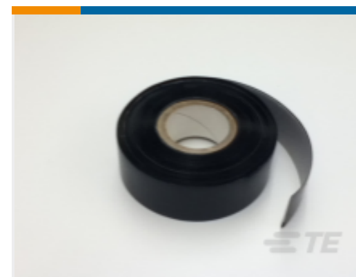
TE 产品编号890901-006 S1030