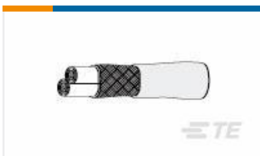
TE 产品编号3823063009 44A1121-16-0/9-9