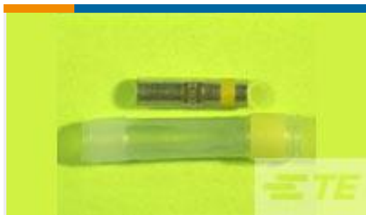
TE 产品编号 650076-000 D-436-38