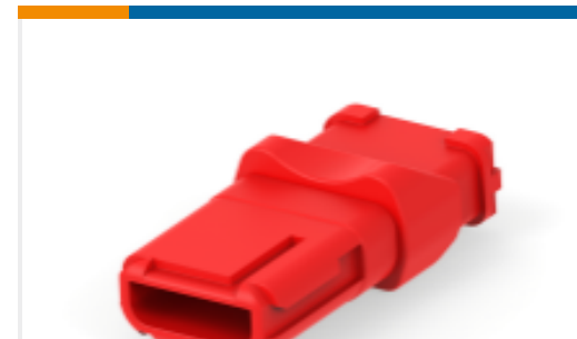
TE 产品编号D369-R33-BS0 矩形连接器，3 路母端