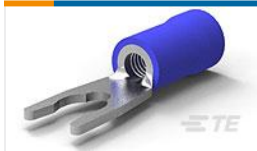
TE 产品编号53244-2 TERMINAL,PG SPR SPD 16-14 8