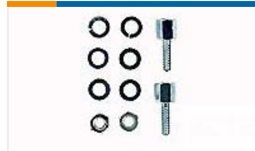
TE 产品编号5745563-1 HD KIT,SCREWLOCK FEMALE