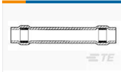
TE 产品编号D17660-000 D-200-82