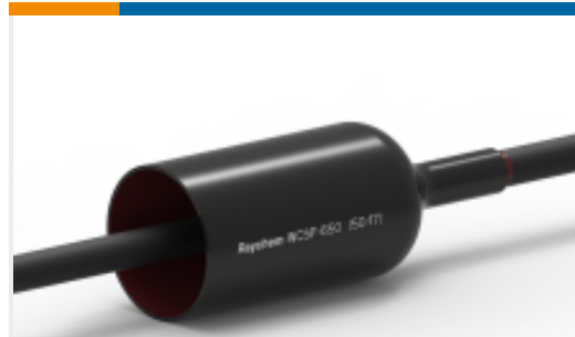
TE 产品编号208454-000 核厚壁热缩管