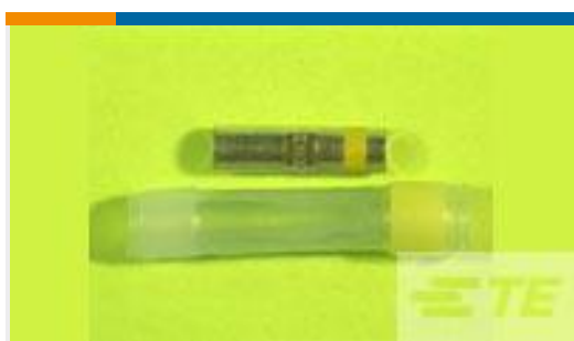
TE 产品编号 650075-000 D-436-37