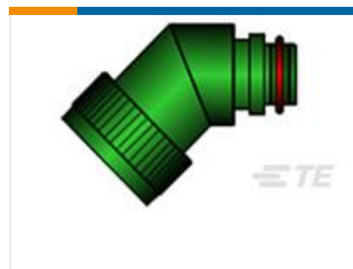
TE 产品编号A05444-000 TXR41AB45-2008BI