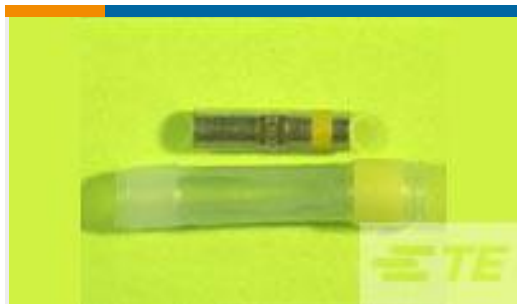
TE 产品编号 650076-000 D-436-38