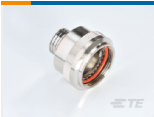
TE 产品编号70H1-19-16-1-B 70H1-19-16-1-B