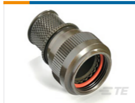
TE 产品编号BTH1-15-08-1-ZN BTH1-15-08-1-ZN