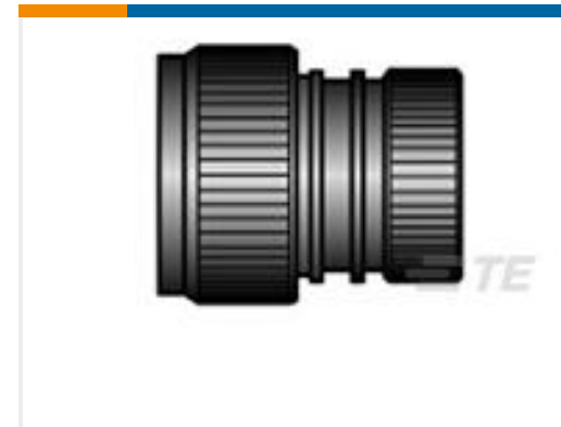
TE 产品编号CV5805-000 HEX40-AC-00-23-A13-2