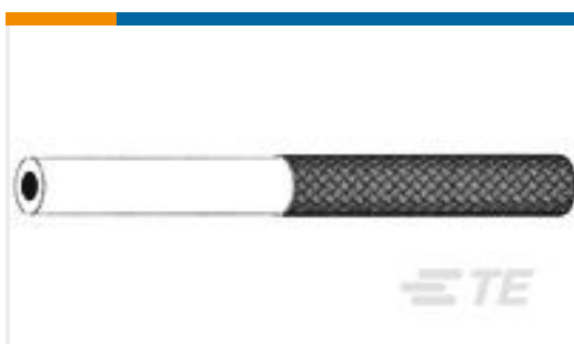
TE 产品编号A513413001 RAY-101-6.0(100)