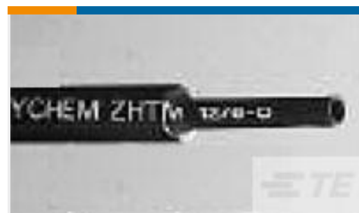
TE 产品编号2023374003 ZHTM-5/2.5-0-SP