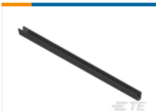
TE 产品编号5068832008 TPEM-NR9-0-STK