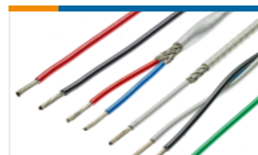
TE 产品编号5386573001 99M0131-20-0/2/9