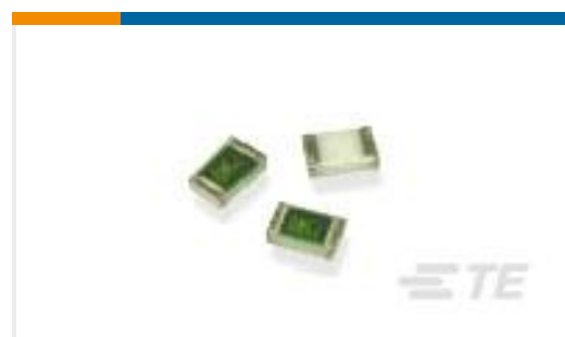
TE 产品编号9-1879127-8 RN 0402 536R 0.1% 10PPM 1K RL