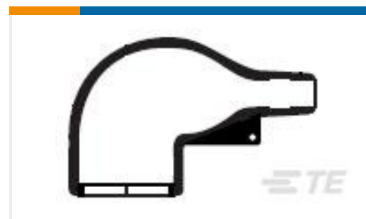
TE 产品编号878514-000 222K152-25-0