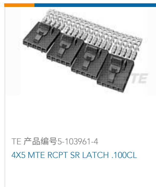
TE 产品编号5-103961-4 4X5 MTE RCPT SR LATCH .100CL