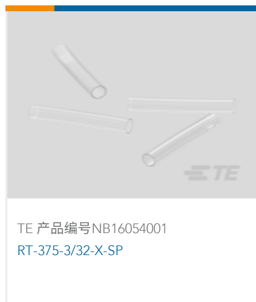
TE 产品编号NB16054001 RT-375-3/32-X-SP