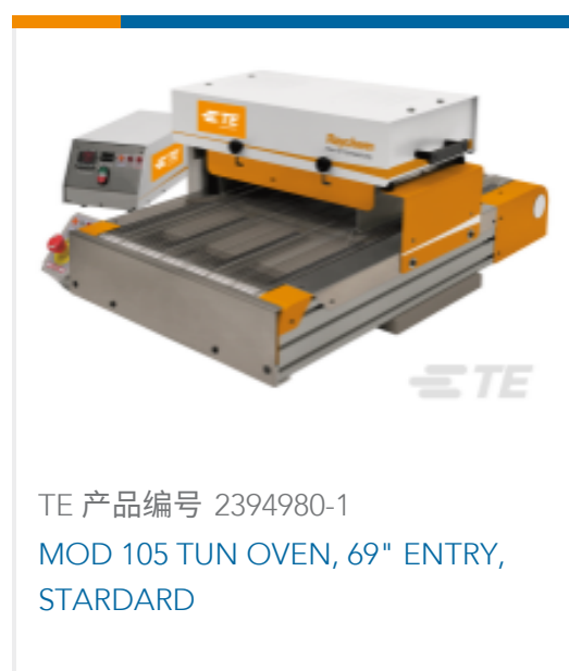
TE 产品编号 2394980-1 MOD 105 TUN OVEN, 69" ENTRY, STANDARD