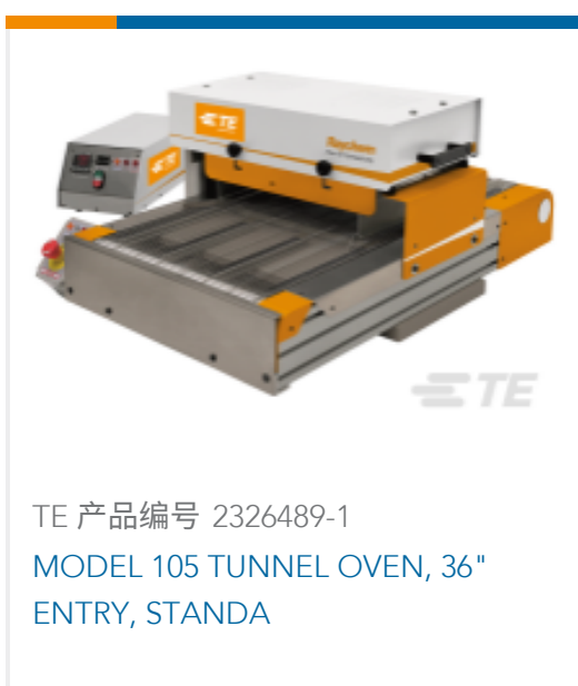
TE 产品编号 2326489-1 MODEL 105 TUNNEL OVEN, 36" ENTRY, STAND