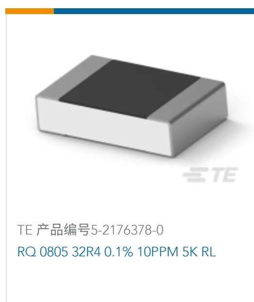
TE 产品编号5-2176378-0 RQ 0805 32R4 0.1% 10PPM 5K RL