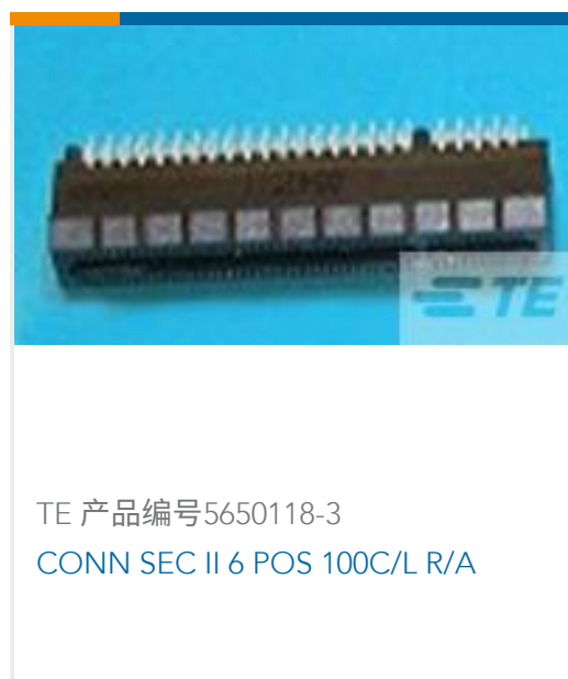
TE 产品编号5650118-3 CONN SEC II 6 POS 100C/L R/A