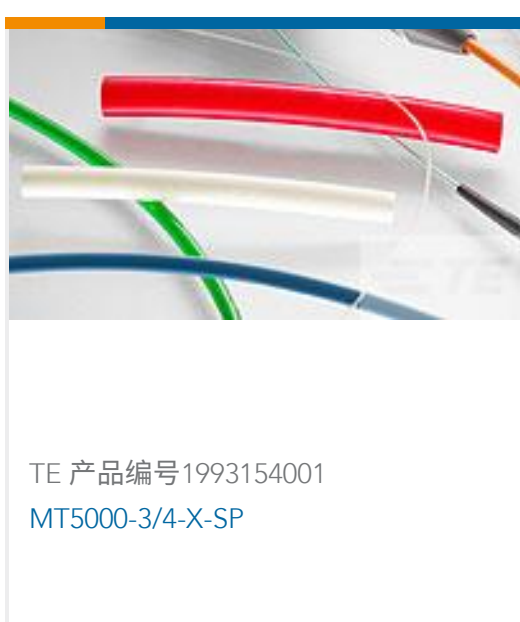
TE 产品编号1993154001 MT5000-3/4-X-SP